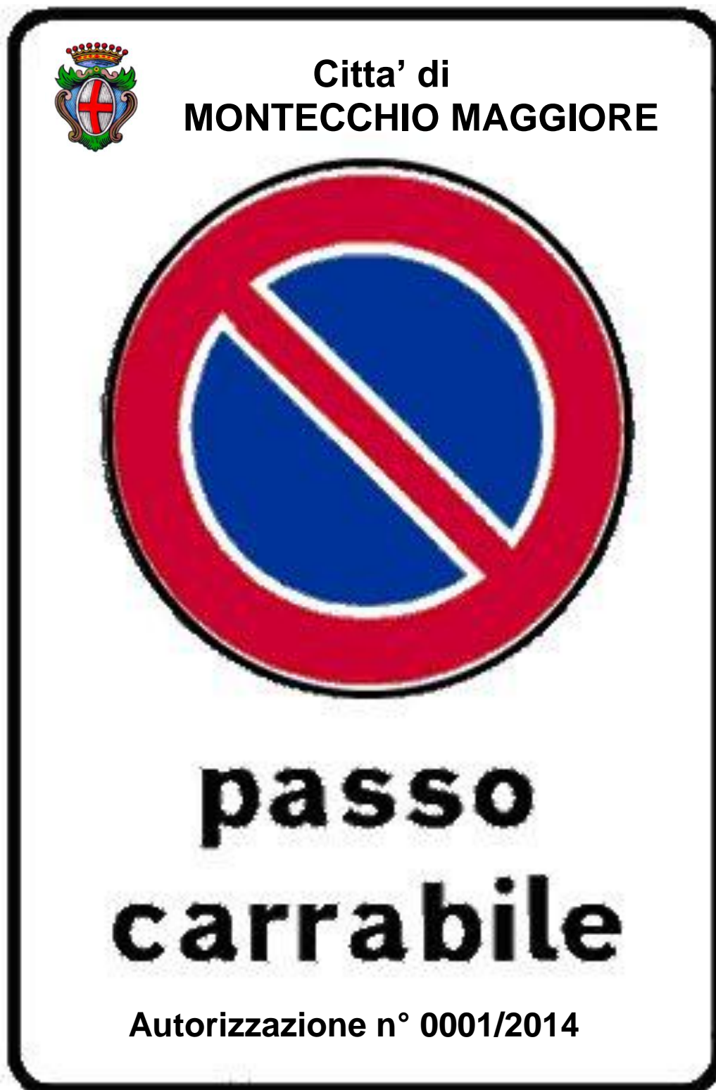
Fig. II 78 - Art. 120 comma 1° lett. e) Reg. Att.ne del Codice della Strada